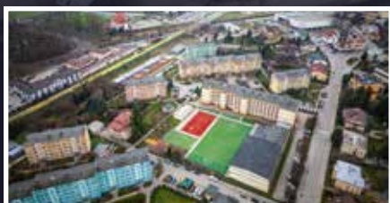
Będzie III etap remontu boiska przy MZS nr 4 - s.5