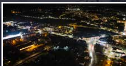
Zmodernizowaliśmy miejskie oświetlenie! - s.7