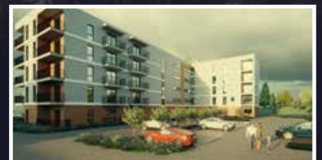
Miasto wybuduje nowy blok przy ul. Korczaka - s.8